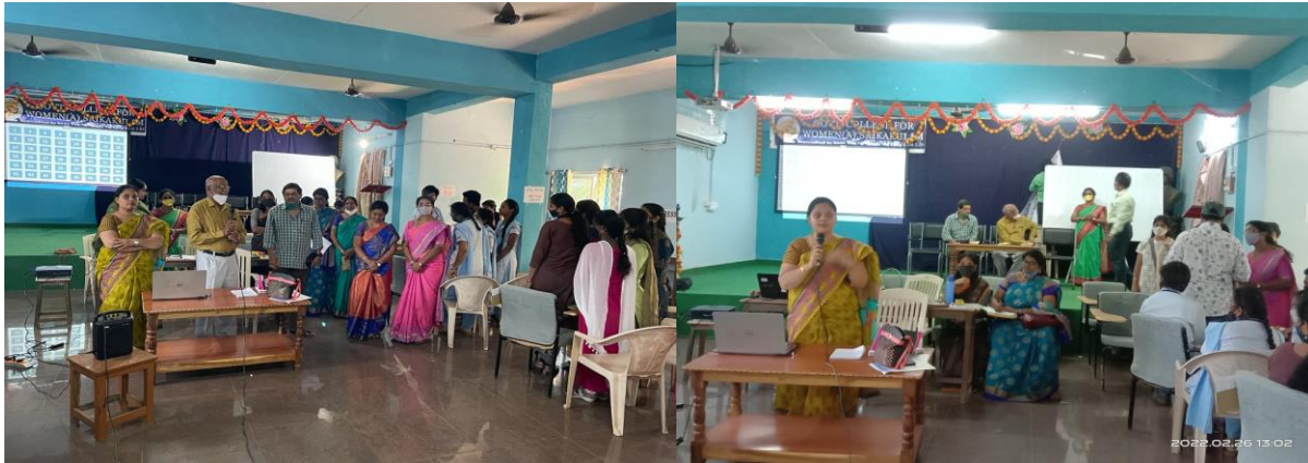
Day 1: Inter collegiate quiz competition and Poster presentation contest were conducted for undergraduate students