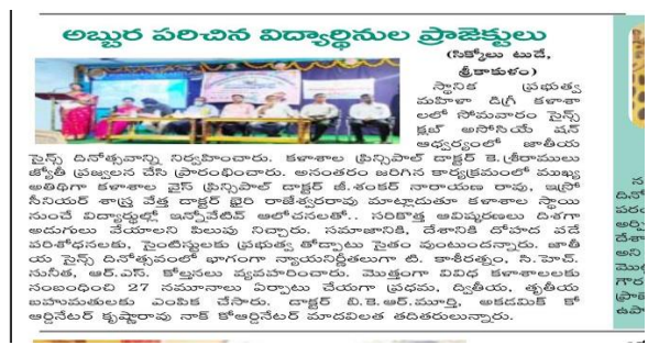
Day 2: Science day celebrations were conducted in GDCW(A) where students came up with their science projects prepared by themselves.