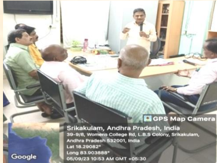
Srikakulam, Andhra Pradesh, India 39-9/8, Womens College Rd, L.B.S Colony, Srikakulam, Andhra Pradesh 532001, India Lat 18.29082° Long 83.903888° 05/09/23 10:53 AM GMT +05:30