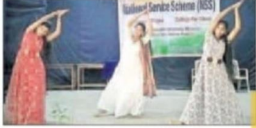
ఆకట్టుకున్న ఎన్ఎస్ఎస్ వలంటీర్ల ప్రదర్శన