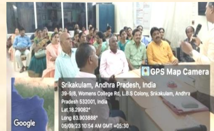
Srikakulam, Andhra Pradesh, India 39-9/8, Womens College Rd, L.B.S Colony, Srikakulam, Andhra Pradesh 532001, India Lat 18.29082° Long 83.903888° 05/09/23 10:54 AM GMT +05:30