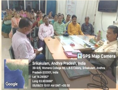
Srikakulam, Andhra Pradesh, India 39-9/8, Womens College Rd, L.B.S Colony, Srikakulam, Andhra Pradesh 532001, India Lat 18.29082° Long 83.903888° 05/09/23 10:51 AM GMT +05:30